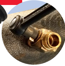
CSK en uso

Se ajusta a la llave o lengüeta en válvulas corporativas, apertura o cierre.